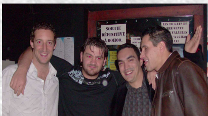
Quoi d'Neuf Doc'?