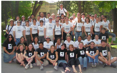
Participants et équipe organisatrice au départ du Rallye 2007