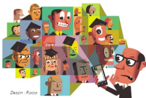
Dessin : Rocco

Dans le numéro du mois de janvier, un dossier spécial était consacré aux réseaux sociaux professionnels. La mise en ligne d'un C.V. précis, concis et pertinent fait également partie de cet effort de visibilité numérique accrue de votre travail et de votre savoir-être. Sachez qu'il existe des sites, où l'inscription est gratuite, où vous pourrez créer en quelques minutes seulement des C.V. attrayants et parfaitement fonctionnels : moncv.com, doyoubuzz.com ou encore cvnumerique.com. Couleurs, thèmes, polices, plus besoin d'être un webdesigner expérimenté pour produire un C.V. original à l'ambiance graphique personnalisée. Ces sites permettent également