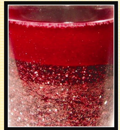
Bonne réponse: 3

450 euros de prix (offerts par l'IRD, CNRS et Agropolis International) seront décernés par un jury de professionnels de la recherche, communication et de la photo.